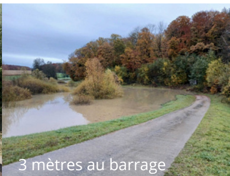
3 mètres au barrage