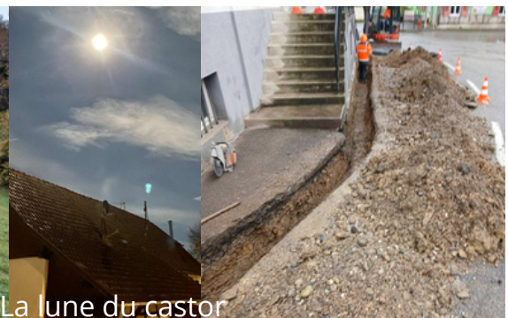
La lune du castor