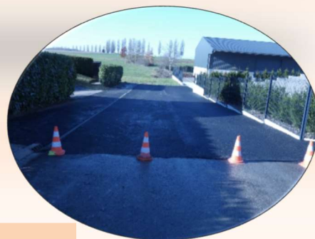
Les enrobages rue de Largitzen, du Moulin et des Prés