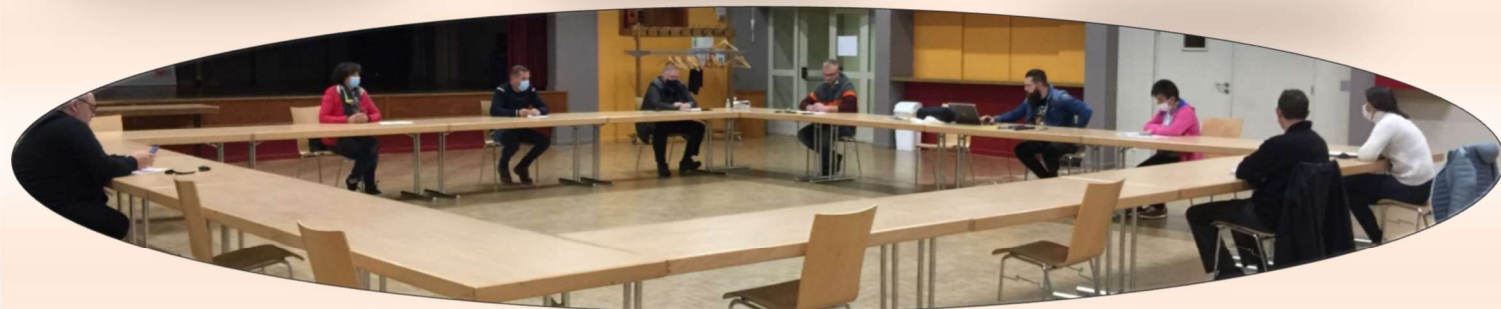
L'AG du Comité de Gestion de la MPT