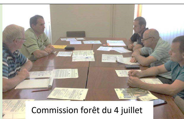
Commission forêt du 4 juillet

Le Comité de Gestion recherche un (e) secrétaire et un (e) trésorier (ere) adjoint(e) .