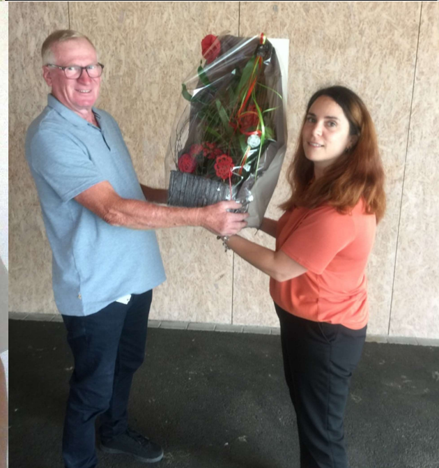
Le départ de Mme Stehlin, enseignante