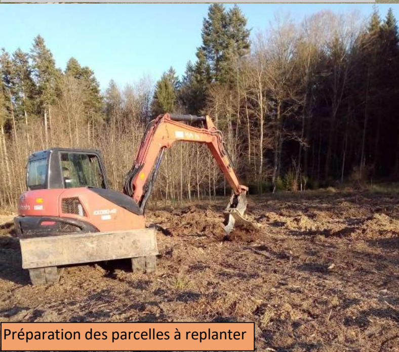
Préparation des parcelles à replanter