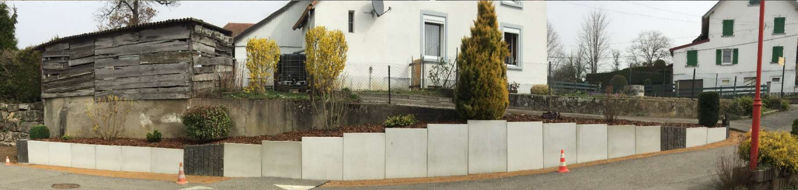
Le mur devant la MPT réalisé par l'entreprise Brissinger